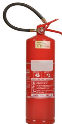
Figura 5 – extintor de incêndio

Equipamentos de formato cilíndrico, alocados em pontos estratégicos para serem utilizados em caso de princípio de incêndio;