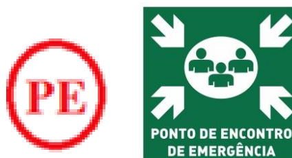
Figura 1 – Modelos de placa de sinalização indicando o ponto de encontro.

Ponto seguro, onde todos os colaboradores de uma determinada área se concentram e esperam instruções da Brigada de Emergência.