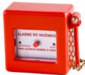
Figura 2 – Botão de alarme de incêndio.

São os dispositivos de acionamento manual do alarme de emergência, distribuídos nos halls dos elevadores;