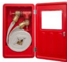
Figura 3 – hidrantes

Constituem-se de um armário fixado nas paredes dos halls dos elevadores com mangueiras e esguichos;