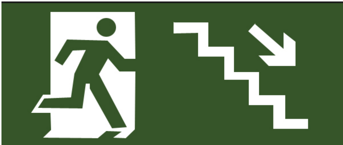
Figura 7 – Placa de sinalização de saída de emergência.

Obs 2: Na evacuação do prédio, NÃO UTILIZAR O ELEVADOR, apenas as escadas para saída do local.