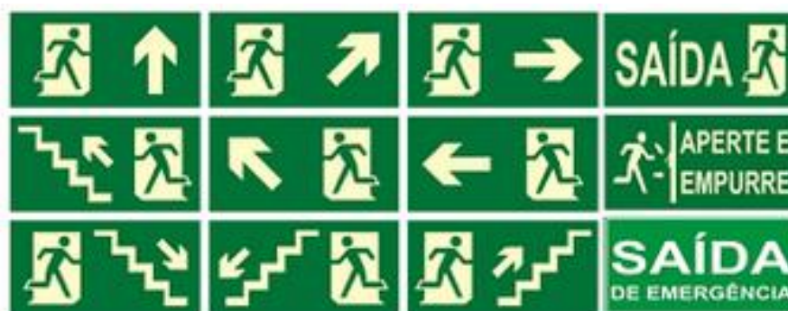
Figura 4 – sinalização de saída de emergência.

Placas indicando a saída de emergência e onde estão os equipamentos de combate a incêndio.