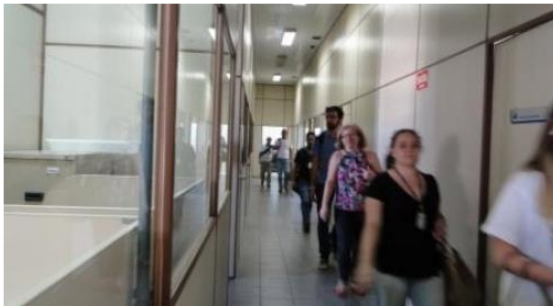
Figura 6 – População em exercício de evacuação de prédio.

Exercício envolvendo um cenário de emergência, nos limites da Instituição e/ou fora da mesma, que requeira a participação da Brigada de Incêndio em operações de emergência.